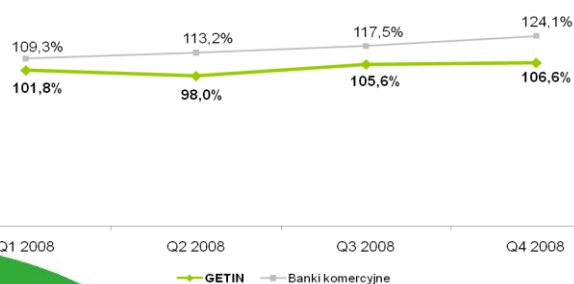
Wskaźnik Kredyty/Depozyty (%)

W 2008 roku GETIN Holding po raz kolejny osiągnął dynamikę wzrostu wyższą od średniej dla całej branży. Największy wzrost odnotowany został w udziale w saldzie depozytów banków komercyjnych